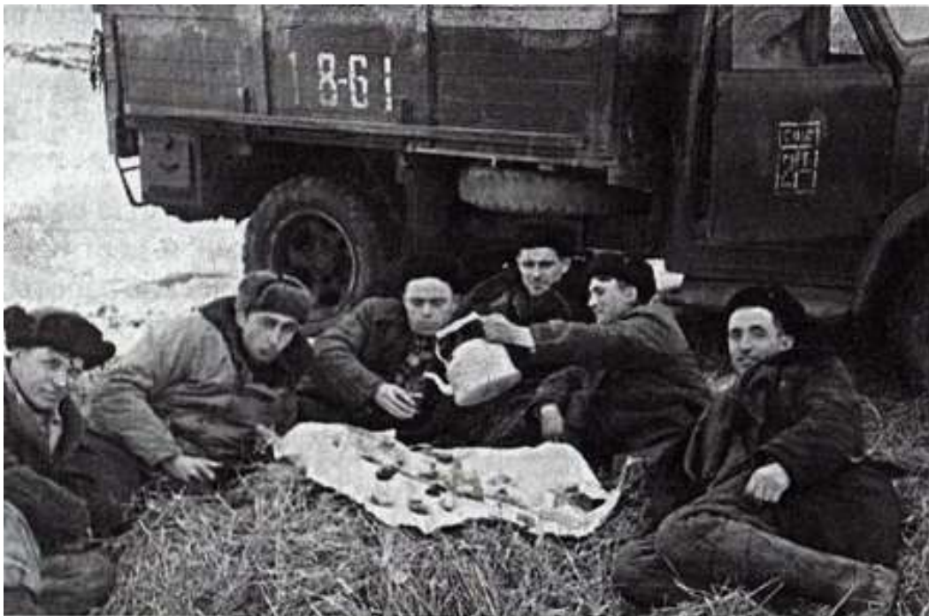
Полный романтики и неустойчивого оптимизма быт шахтостроителей - обед.

1957 — ЦК КПСС объявил общественный призыв молодёжи на работу в Донбассе